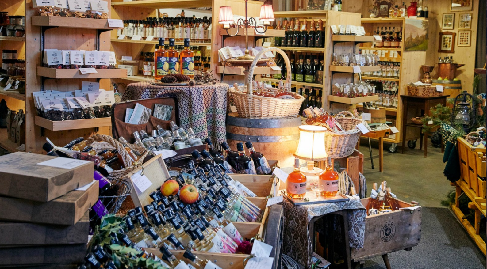
Haldihof in Weggis