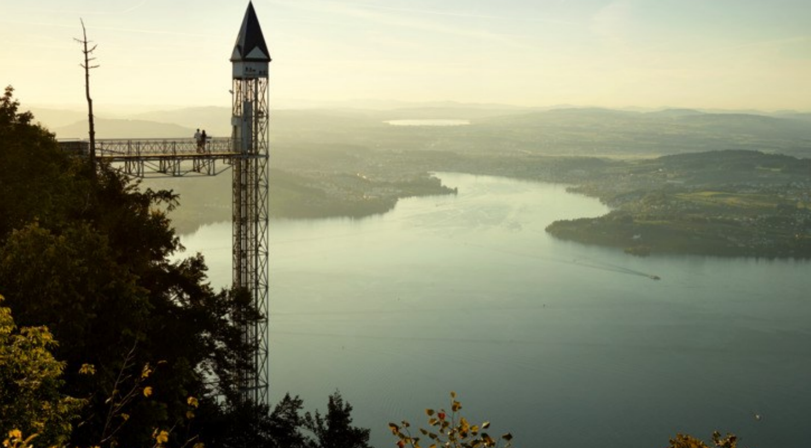
Hammetschwandlift über dem Vierwaldstättersee