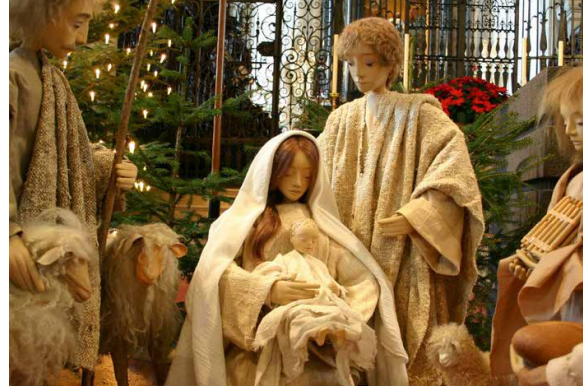
Schwarzenberger Krippenfiguren in der Hofkirche